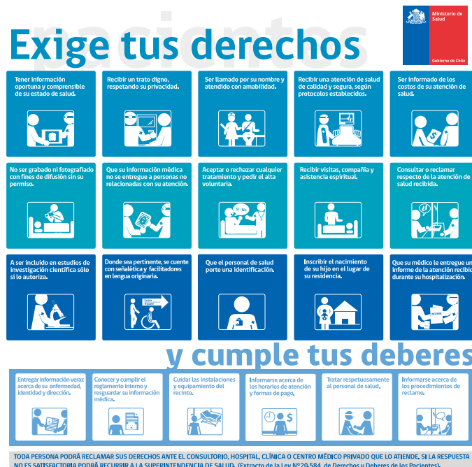
ILUSTRACIÓN 1: CARTA DE DERECHOS Y DEBERES DE LOS PACIENTES

El sector salud participa en varios programas de protección social, todos de carácter intersectorial, como son Chile Solidario, la Reforma Previsional, Chile Crece Contigo y el Programa Vínculos del Ministerio de Desarrollo Social.