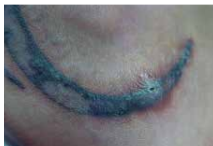
Reacción a cuerpo extraño