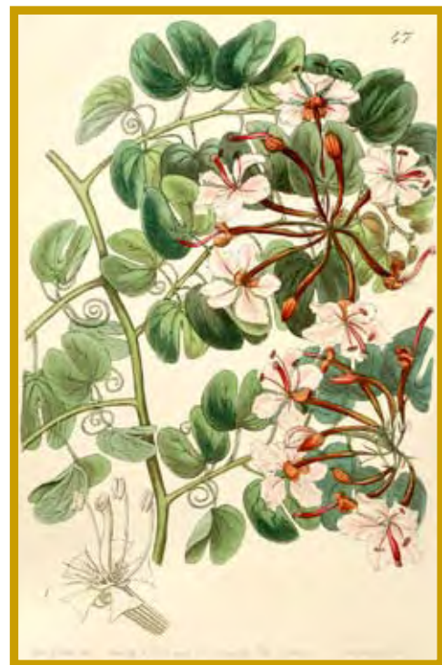
Bauhinia corymbosa .

http://delta-intkey.com/angio/images/br39047.jpg