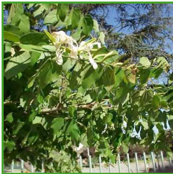
(original RC Peña).