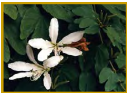
Follaje con flores.

También puede multiplicarse por esquejes, que se hacen enraizar y después se llevan a vivero hasta que alcanzan un desarrollo tal que puedan ser plantados en el campo. En Brasil existen trabajos de mejoramiento y cultivo de Bauhinia spp.