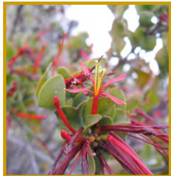
Tristerix corymbosus (L.) Kuitj (quintral del álamo, maqui, maitén, pampalén y trevo). http://www.geocities.com/atrenqua/dicotyle/species/ltrcorym.htm?rm

Hábito de la planta. a y b. Ramilla con flor abierta, c. Detalle de la flor