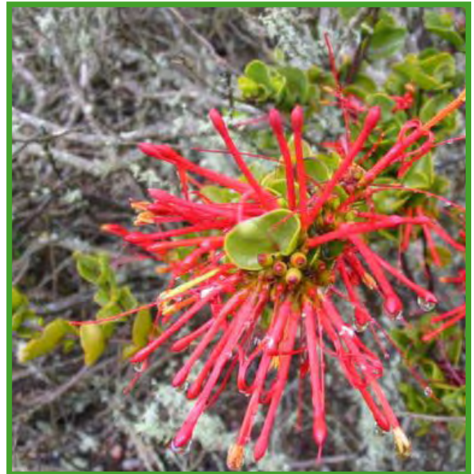
Tristerix tetrandus parasitando a un olivillo.

Aspectos agronómicos: el género Tristerix consta de 11 especies enteramente circunscritas a Sudamérica, donde habitan desde sectores adyacentes a la Cordillera de Los Andes en Chile y Argentina hasta el sub-páramo de Colombia y Ecuador. El quintral del álamo es un muérdago nativo de América austral, sur de Argentina, centro y sur de Chile. Se le encuentra como planta parásita principalmente sobre álamos ( Populus sp. ), colliguay ( Colliguaya odorifera ), sauces ( Salix sp. ), etc. No hay antecedentes sobre su cultivo; los recolectores de plantas medicinales recogen quintral de ejemplares silvestres, que luego secan y envasan para su venta