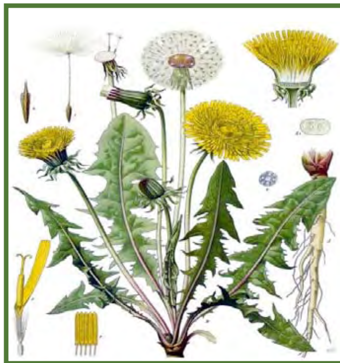
Taraxacum officinale , Koehler (1887).

Presentación comercial: en farmacias se encuentran a la venta varios preparados que contienen T. officinalis , una mezcla de extractos hidroalcohólicos de alcachofa, boldo, hinojo y diente de león, indicada como estimulante hepático con débil efecto laxante.